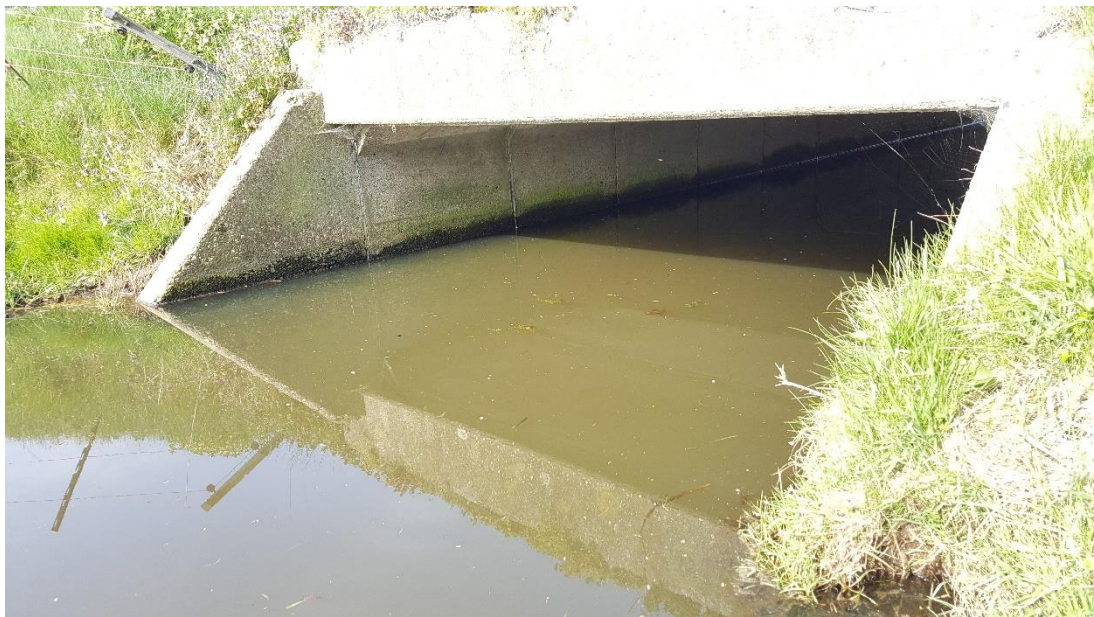
Figuur 4: Foto locatie tijdens veldbezoek op 9 april 2019.