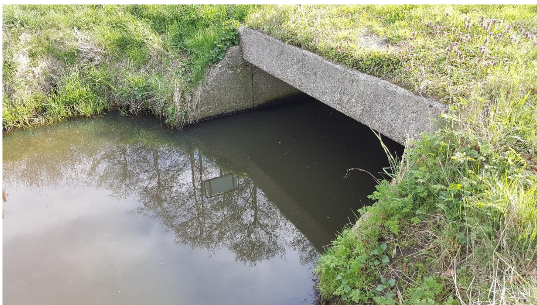
Figuur 3: Foto locatie tijdens veldbezoek op 9 april 2019.