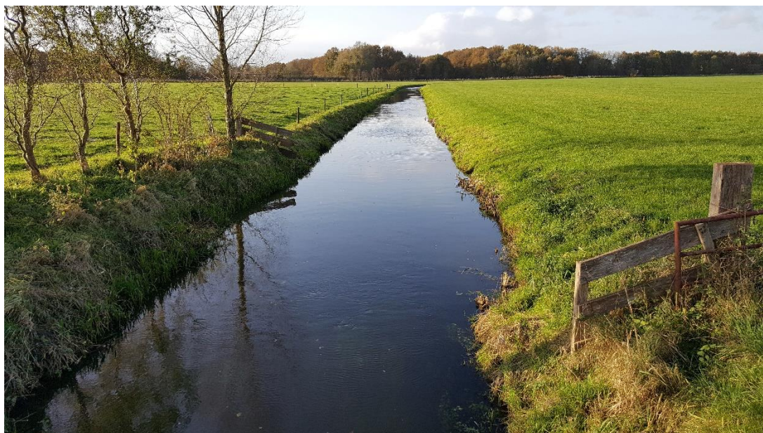
Figuur 6: Foto locatie tijdens veldbezoek op 13 november 2017 (benedenstroomse zijde).