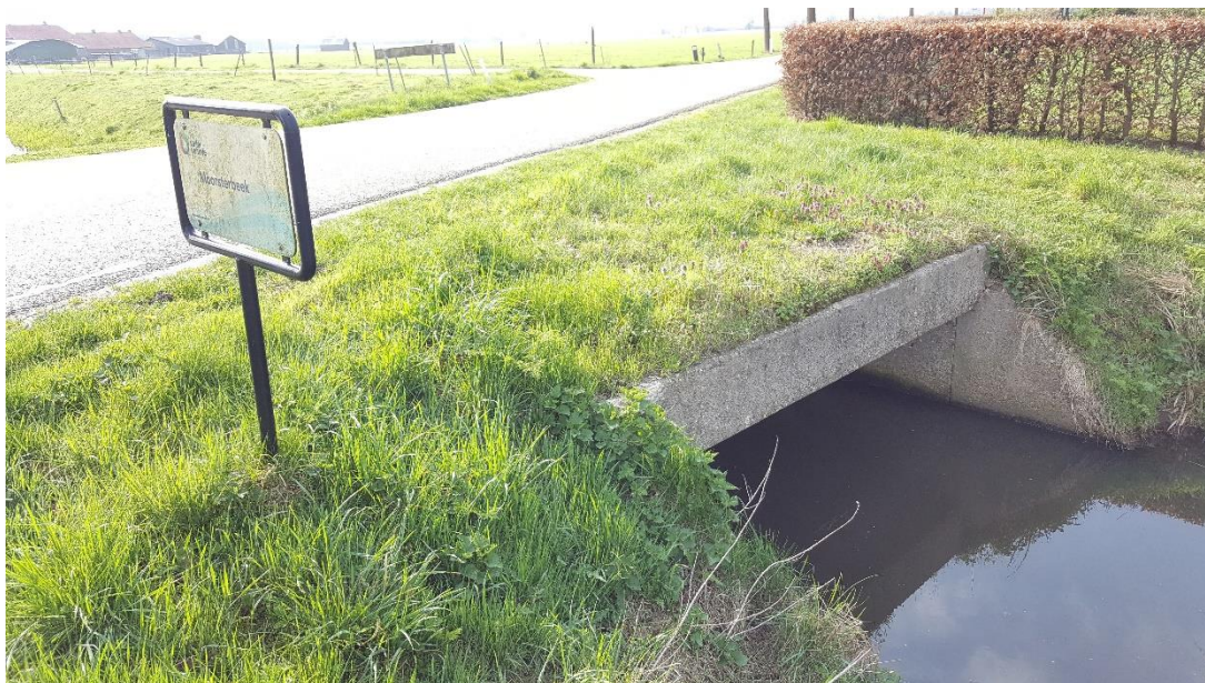
Figuur 2: Foto locatie tijdens veldbezoek op 9 april 2019.