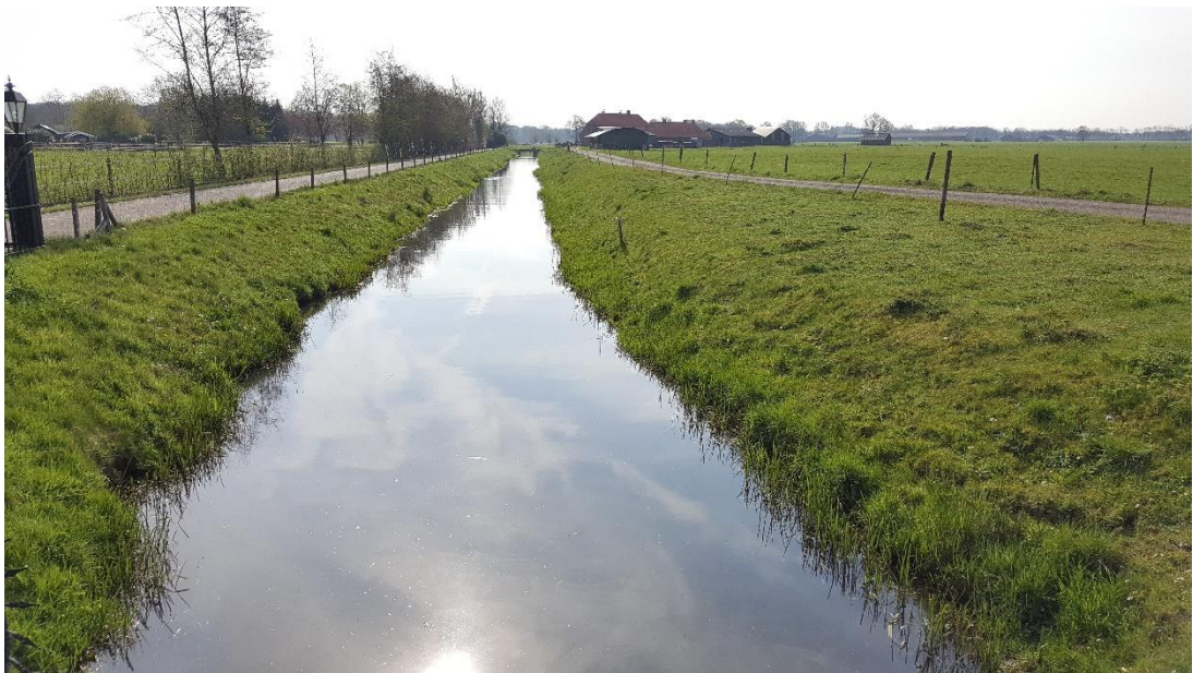
Figuur 5: Foto locatie tijdens veldbezoek op 9 april 2019 (bovenstroomse zijde).